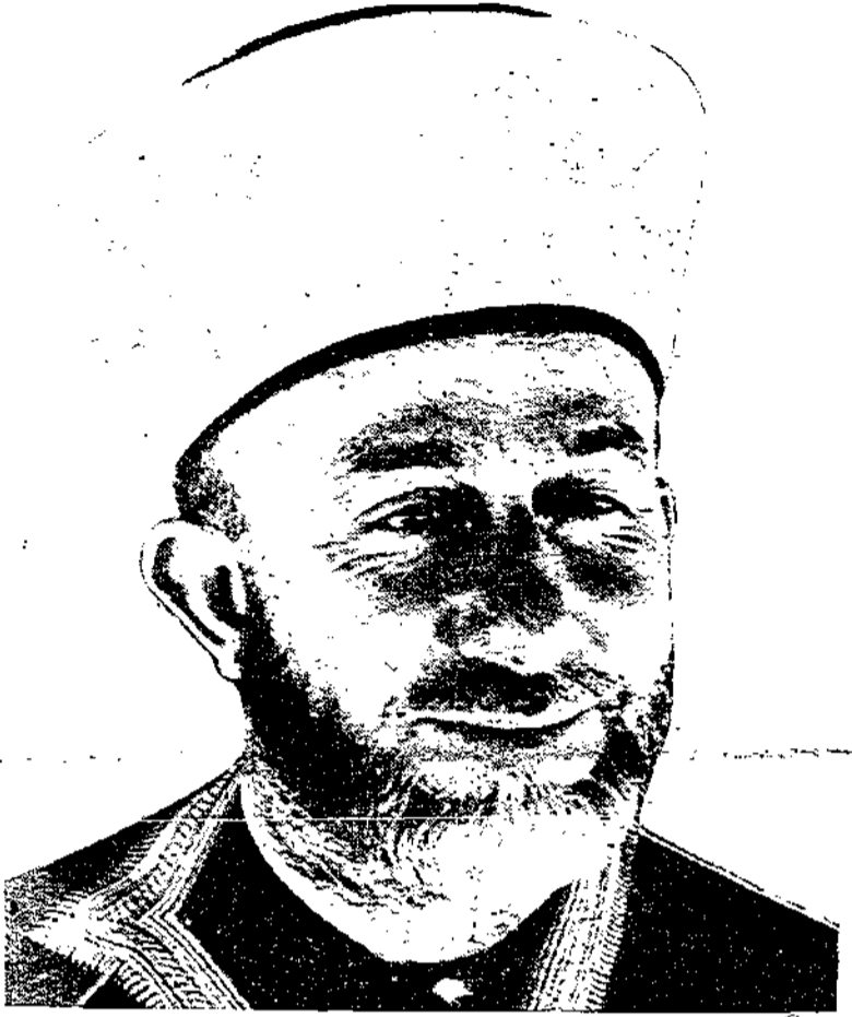
رسم طبيعي لحاجه السيد امين الحسيني زعيم فلسطين