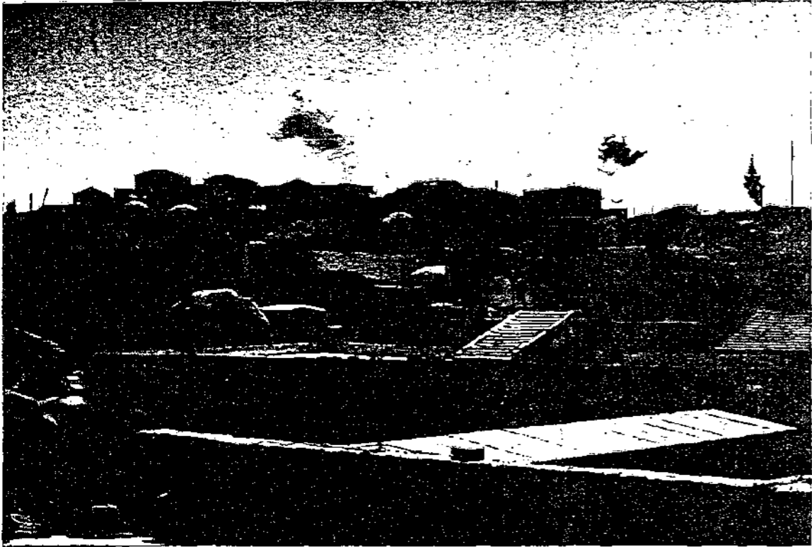
منظر لجانب من مدينة يافا القديمة

عند نسفها بأيدى السلطة البريطانية بقرعة سنة ١٩٣٦ وبورى افعال الديناميت فى ارجاء المدينة والدخان يتصاعد والفساد يورثها ساء المدينة