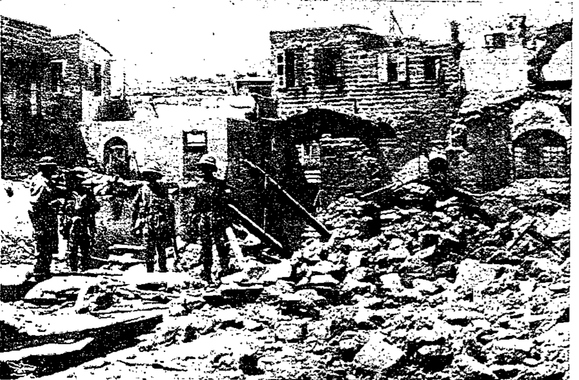
نسف جانب آخر من مدينة يافا بالديناميت

عند نسفها بأيدى السلطة البريطانية بقرعة سنة ١٩٣٦ وبورى افعال الديناميت فى ارجاء المدينة والدخان يتصاعد والفساد يورثها ساء المدينة