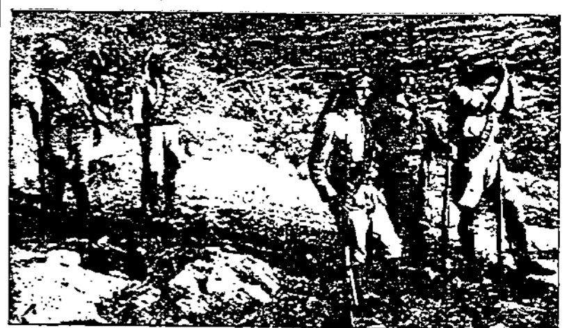
سعدانة فوزي بك القاوقجي قائد ثورة ١٩٣٦ وقد ظهر وهو يشهد بظارته المبكرة انهزم الجيش البريطاني بعد معركة بلعا وقد وقت خلفه أربعة من كبار المجاهدين الابطال