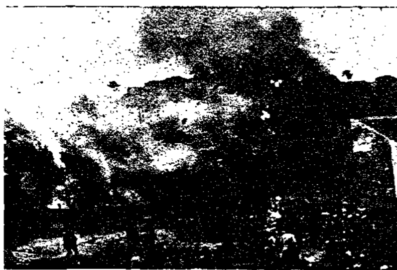
جانب من يافا عند ما نسفها الانكليز بالديناميت

وحاجم الجهاديون مركز البوليس فى طولكرم وأطلقوا عليه نحو ٢٠٠ رصاصة فأجاب البوليس بالمثل وحاجم الجهاديون عزم مصالحة الاثنان العامة بجوار القدس واستولوا على ما فيه من أموال وأتقوا أسلاك الكبرياء لتركه روتتيرج اليهودية فى مدينتها