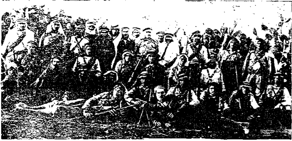
فريق من مجاهدي فلسطين في ثورة ١٩٣٦ وقد أخذت لهم هذه الصورة في جبال نابلس وبتوسطهم المجاهد الكبير فوزي بك القوافجي تحت علامة X