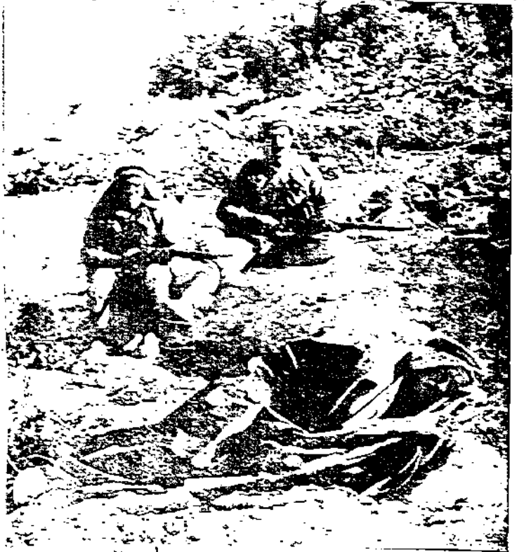
صور لآر أفعلة تميم فوزى بك القرد فوجي وكيف كان يتم في خلال جهاد فلسطين في ثورة ١٣٦٦م بدم بارد عن الأبرار وبجوارحه حرسه الخاص بالسلاح لانه لا يتم في الليل