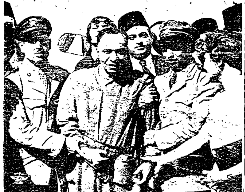
عند وصول الاستاذ عزمى فوق هذا الكلام صورة الاستاذ الكبير الدكتور محمود بك عزمى عند نزوله من الطائرة قادما من بغداد بعد الحادثة وقد ظهر حضرته بملابسه البيضاء وقداستند على اثني من فرقة الاسعاف الطبية وبجواره السيدة حرمة شفاء الله وعافاه .